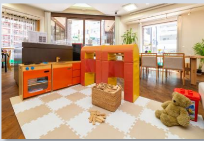
キッズスペースのご用意がございます。お子様と一緒にゆっくりご相談いただけます。