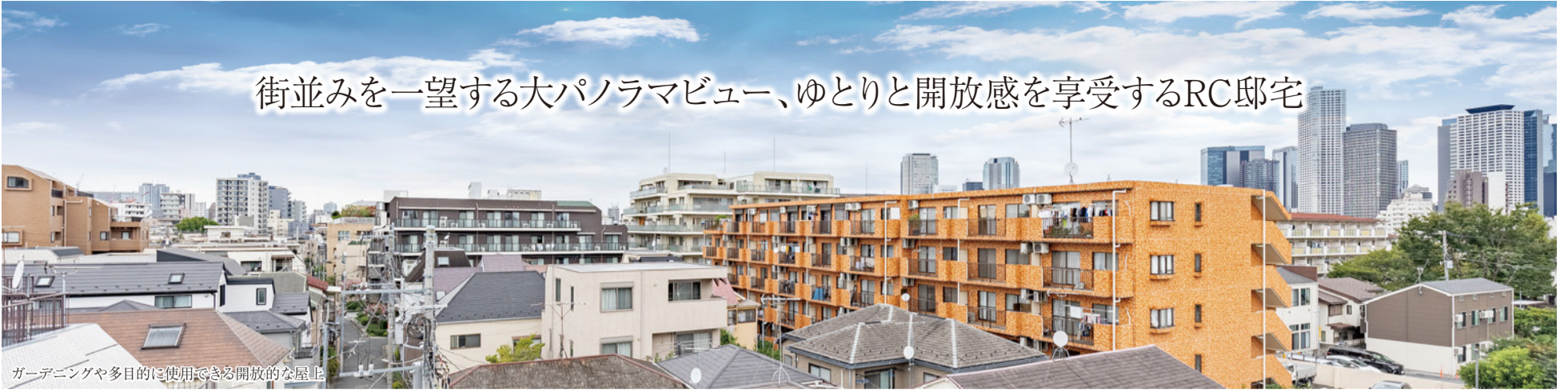
ガーデニングや多目的に使用できる開放的な屋上