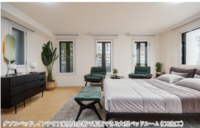
ダブルベッド、インテリア家具も余裕で配置できる大型ベッドルーム (CG加工)

3LDK+S ■対面式キッチン ■3.5帖の大型ストレージルーム ■ウォークインクローゼット ■シャッター付ガレージ ■ガーデニングも可能な屋上ルーフトップ