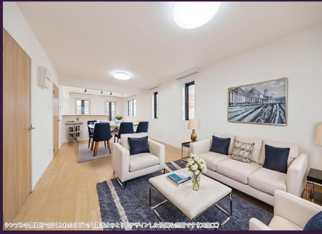
シンプルな間取りで広くとれたリビング、採光とゆとりをデザインした快適な空間です (CG加工)

東京メトロ丸ノ内線 「中野新橋」駅徒歩9分 都営大江戸線 「西新宿五丁目」駅徒歩12分