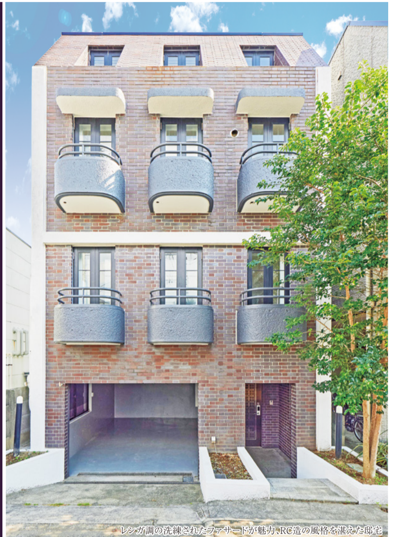
レンガ調の洗練されたファサードが魅力、RC造の風格を醸した邸宅