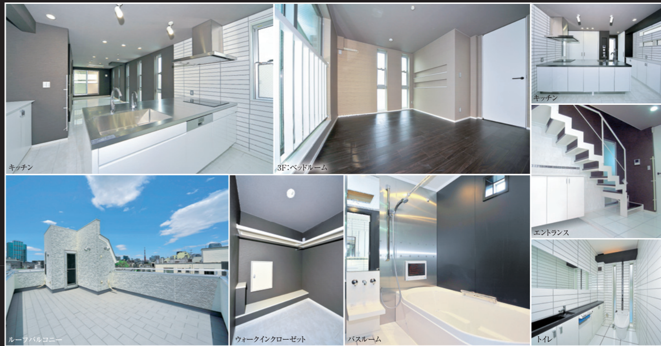
2F:リビングダイニング